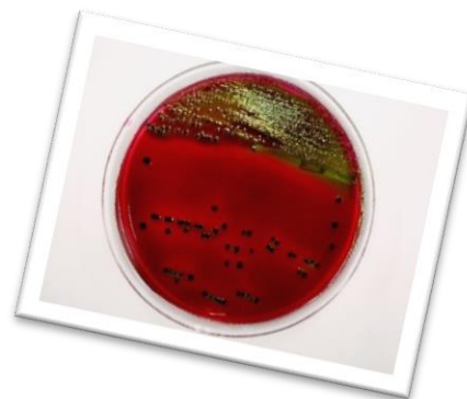
EMB培地上の E.coliのコロニー